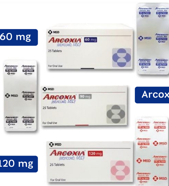
Arcoxia 90 mg

กลุ่มงานเภสัชกรรมและเวชภัณฑ์กลาง โรงพยาบาลจุฬารัตน์