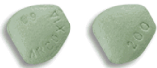
Arcoxia 60 mg