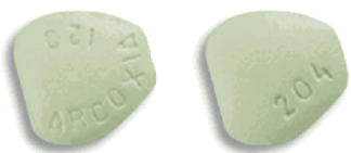
Arcoxia 120 mg