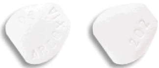
Arcoxia 90 mg